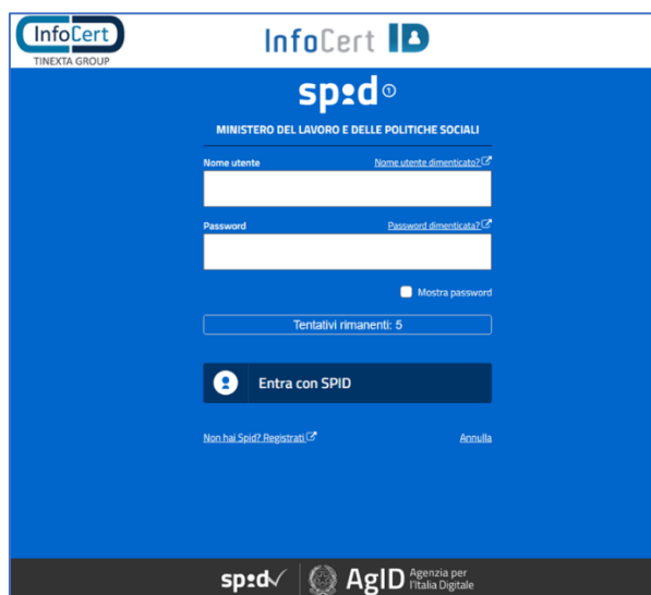
Figura 4 – Finestra di accesso mediante SPID di InfoCert ID