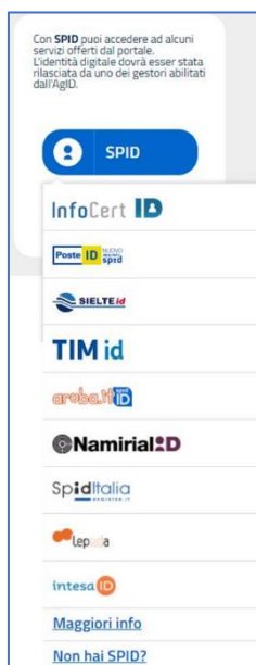
Figura 2 – Selezione Identity Provider